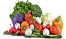
حصاد أي من الفواكه أو الخضروات

2. إذا كانت الإجابة بنعم، هل غيرت أنت أو ذلك الشخص محل إقامتك للقيام بهذا العمل (حتى ولو لفترة قصيرة من الزمن مثل الأسبوع)؟ نعم كلا