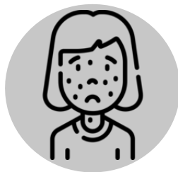
Irritação na pele