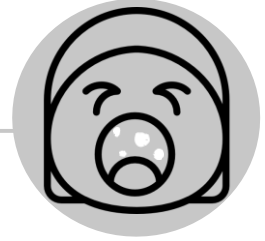
Petites taches blanches à l'intérieur de la bouche

L'éruption cutanée commence généralement sur le visage, au niveau de la racine des cheveux. Elle s'étend ensuite au cou, au torse, aux bras, aux jambes et aux pieds. Lorsque l'éruption cutanée apparaît, la fièvre d'une personne peut atteindre plus de 104 degrés Fahrenheit. Un écoulement nasal et des yeux rouges et larmoyants sont également des symptômes.