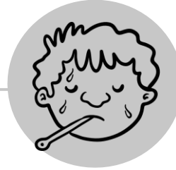
ارتفاع شديد في درجة الحرارة