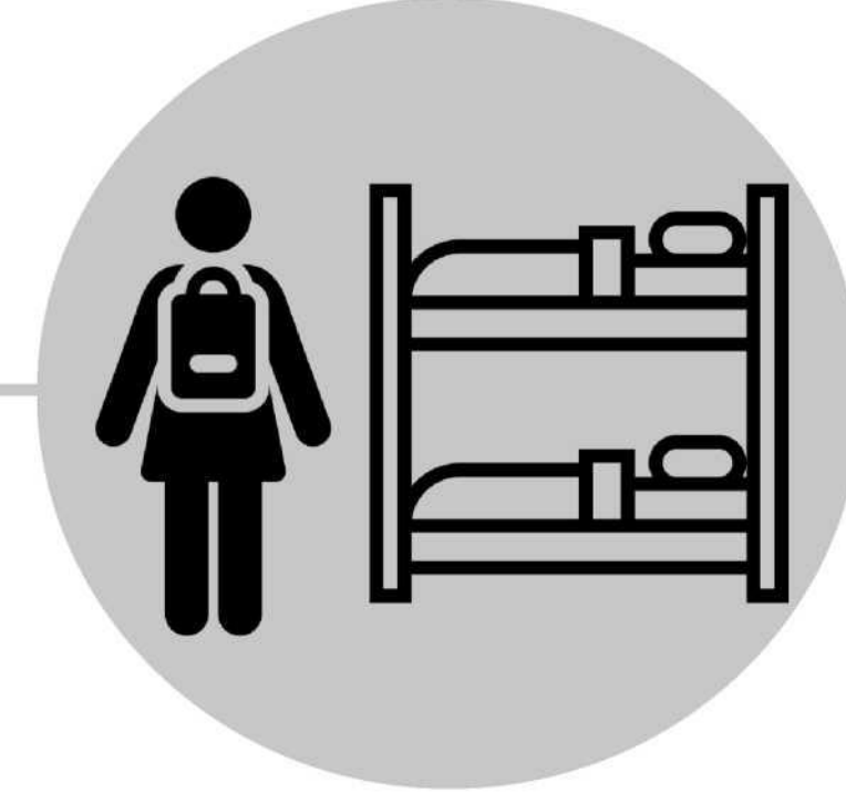
Bana-Kelasi oyo bafandaka na ba dortoirs

Makambo mosusu eza bato oyo babelaka tango nyoso pe basala mibembo na Afrique sub-saharienne.