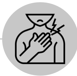
Стиснення в грудях