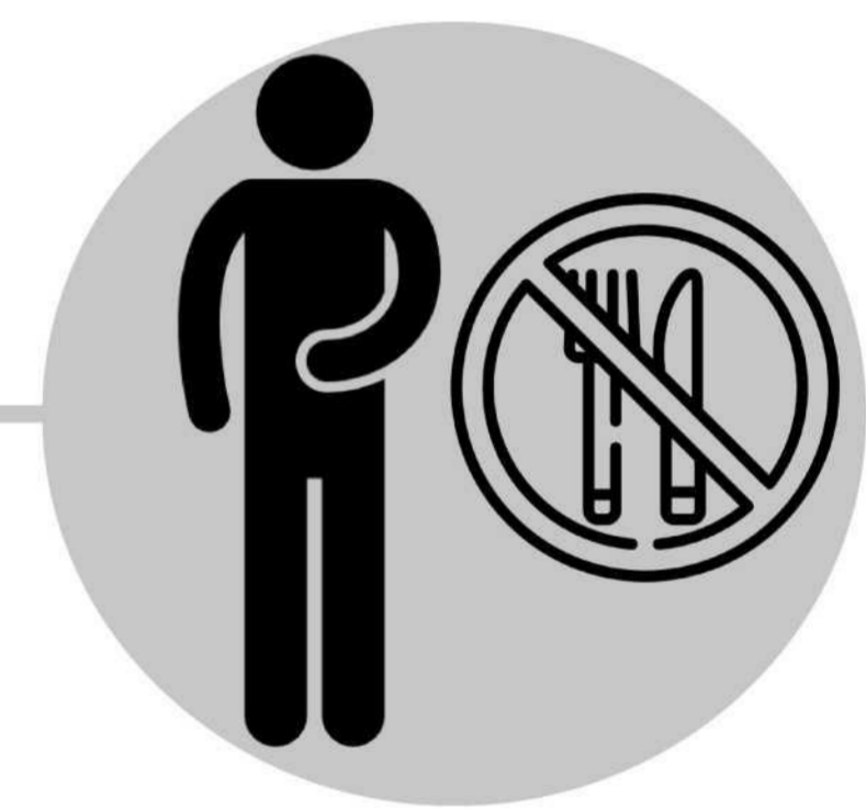
Amateedka oo xumaada

Qandho, dareemid daal, amateedka oo xumaada, iyo madax xanuun ayaa soo muuqan kara maalin ilaa laba maalmood kahor intaan firiiricu kobcin. Firiirica ayaa laga yaabaa inay marka hore kasoo muuqdaan wejiga, laabta, iyo dhabarka kadibna ku fidaan jirka intiisa kale. Tan waxaa ku jira gudaha afka, baalasha indhaha, ama xubnaha taranka. Firiirica ayaa isu beddela cuncun, fin-dheecaan dheecaan ka buuxo kaas oo qub-dhaca toddobaad gudihi. Calaamadaha badanaa waxay soo baxaan 14 ilaa 16 maalmood cudurka kadib, laakiin waxay u dhaxayn karaan 10 ilaa 21 maalmood.