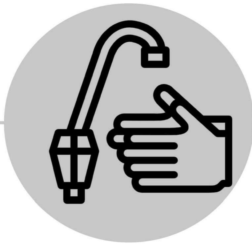
经常用肥皂和水洗手