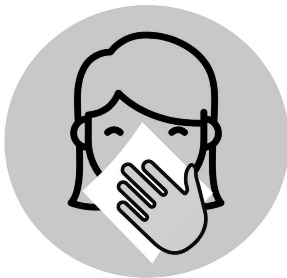
咳嗽或打喷嚏时用纸巾或胳膊肘遮掩。