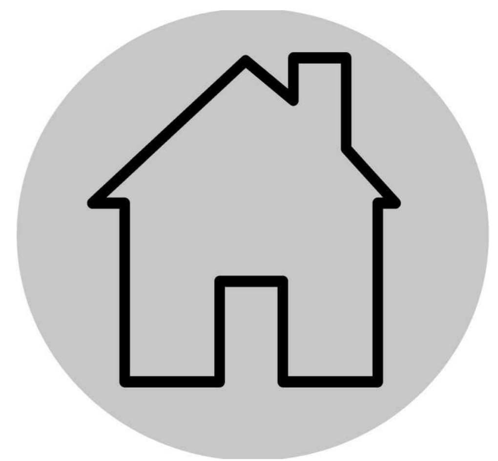
让患病的孩童待在家中