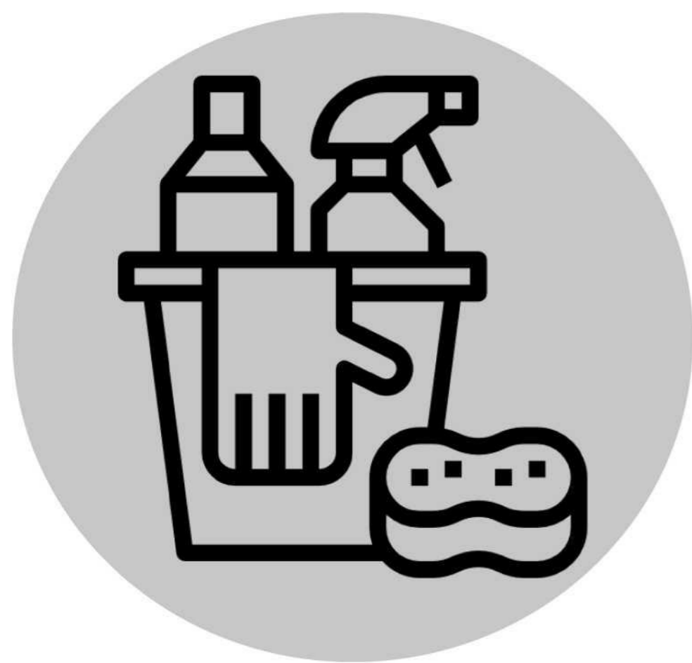
清洁和消毒各类物品（如玩具和门把手等）的表面