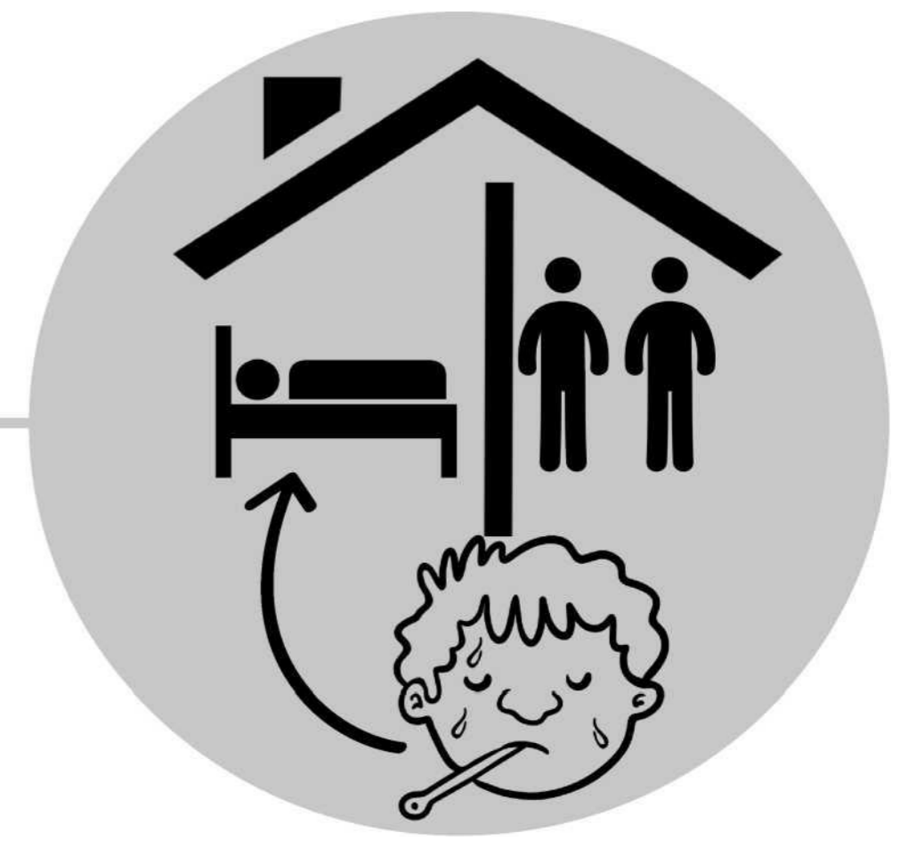
避免与患病者密切接触