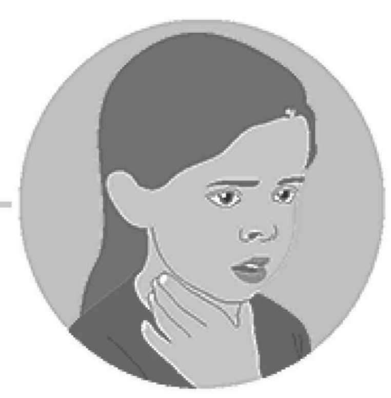
Mikakatano Ya Komina

Koyoka na mbalakaka bolembu ya maboko to ya makolo mpe kobungisa makasi ya misisa mpe ya baréflexes wana nde bilembo oyo emonanaka mingi. Bato misusu bazalaka na: