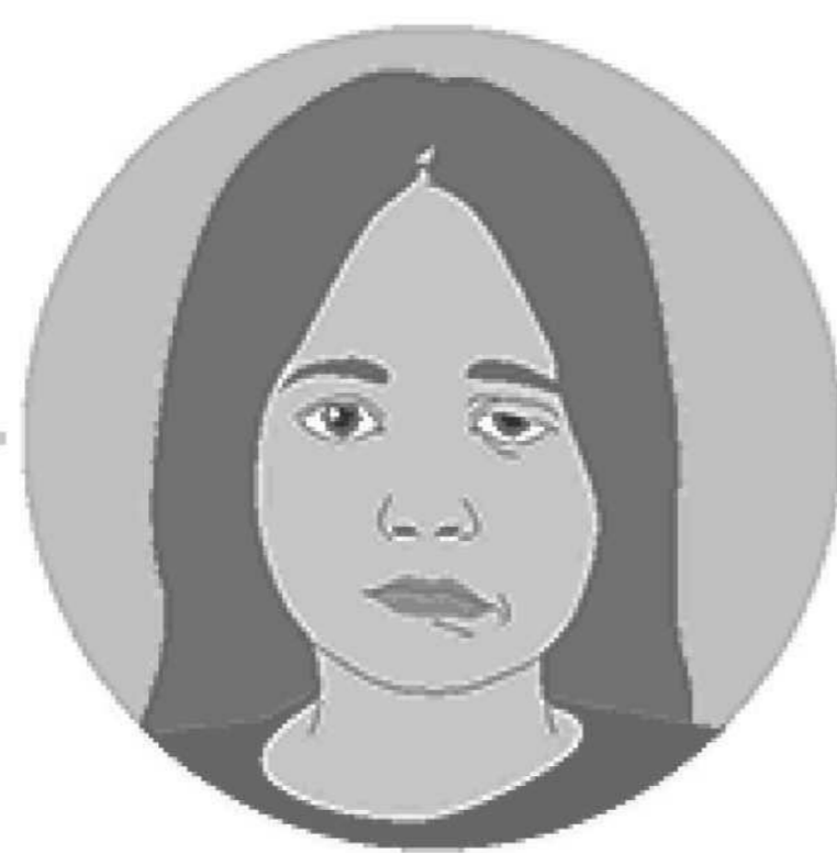
Kokita ya elongi/ Botau