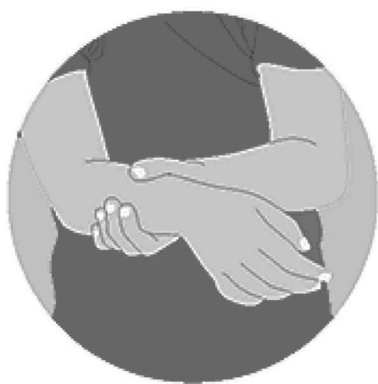
Bolembu ya Maboko na makolo