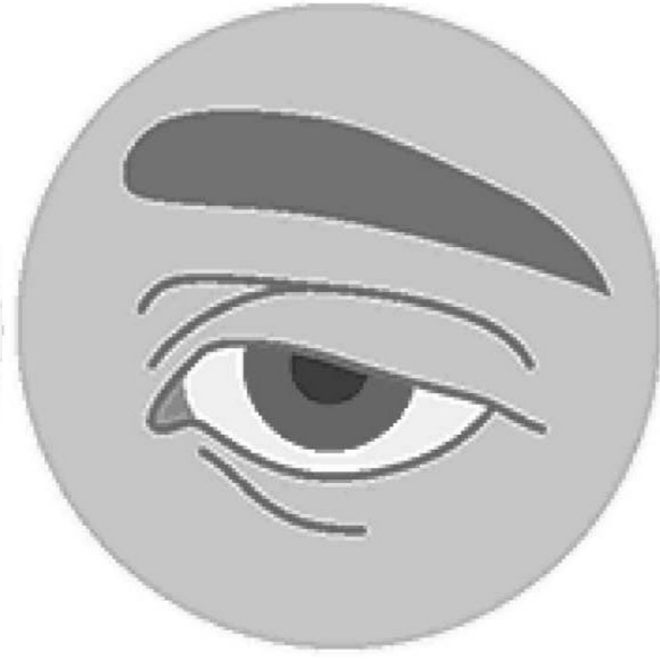
صعوبة في تحريك العينين / تدلي الجفون