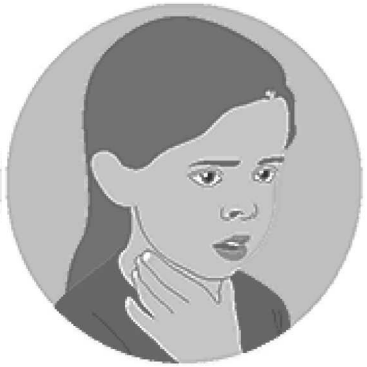
الصعوبة في البلع