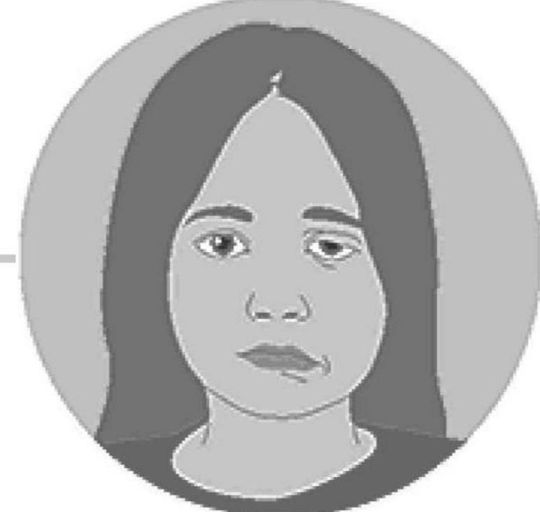
تدلي / ضعف الوجه